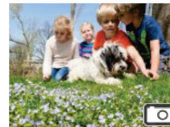
Frühling Frühlingswetter in Hattingen lässt...