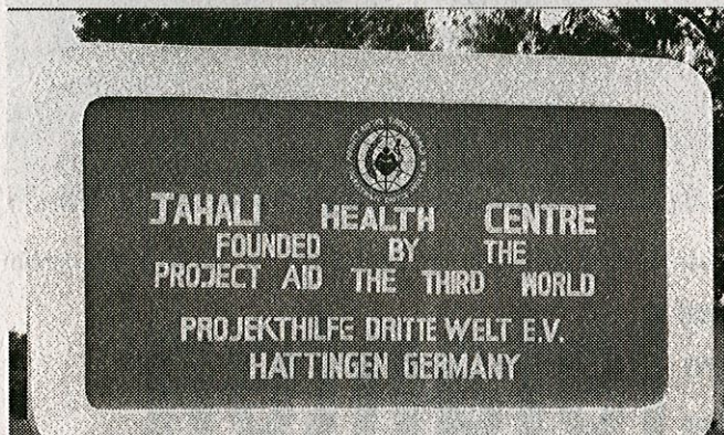
Hattingen und das Health Centre: Der Name der Ruhrstadt ist jetzt auch auf einem Schild der afrikanischen Klinik zu finden.

Ihr Beitrag ist wichtiger denn je. Nächstes Jahr will die Klinik einen Geburtshilfetrakt bauen. 75 Prozent der Kosten könnte der Bund zuschießen. Langfristig wünscht sich Ketteler ein Projekt, das die fehlenden Gelder erwirtschaftet. „Vielleicht eine Mangofarm. Ich bin aber kein Bauer. Ich weiß nur, wie eine Klinik funktioniert.“ aug • Konto 50 963, Sparkasse.