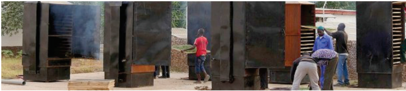
Moringaöfen zum Trocknen.