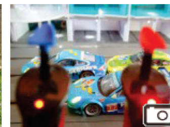
Carrera-Fans Carrera-Fahrer in Bredenscheid