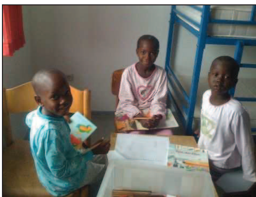
Angekommen im Friedensdorf Oberhausen